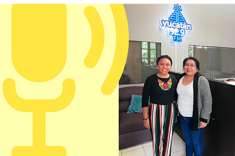
CÁPSULA 3 Participación política de las mujeres mayas.

Este proyecto fue apoyado con recursos del Programa Nacional de Impulso a la Participación Política de las Mujeres a través del Organismo de la Sociedad Civil 2019 y no podrá ser utilizado con fines de lucro con fines de lucro o para otros propósitos.