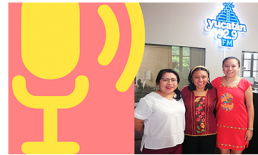
CÁPSULA 2 Violencia política contra las mujeres en razón de género.

Es toda acción u omisión, incluida la tolerancia, basada en elementos de género y ejercida dentro de la esfera pública o privada, que tenga por objeto o resultado limitar, anular o menoscabar el ejercicio efectivo de los derechos políticos y electorales de una o varias mujeres.