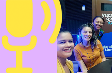
CÁPSULA 1 Ciudadanía y participación equitativa.

Se realizaron tres cápsulas informativas, dos de éstas traducidas al maya, y tienen el objetivo de difundir información importante sobre la participación política de las mujeres, la violencia política contra las mujeres en razón de género y nuestros derechos de votar y ser votas. Aquí puedes encontrar las grabaciones.